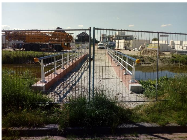
Foto 1 Brug vanaf Kleiwerd naar Reitdiep

De gemeente Groningen en Arcadis vinden veiligheid (veilig wonen en werken) een belangrijke voorwaarde. De eerste bewoners hebben de gemeente Groningen verteld dat een veilige route (voor jonge schoolgaande kinderen) vanuit Reitdiep fase 3 naar de bovenliggende wijken op dit moment ontbreekt. Voor de gemeente Groningen aanleiding om aan Arcadis te vragen de brug vanuit Reitdiep fase 3 naar de Kleiwerd direct klaar te maken voor gebruik.