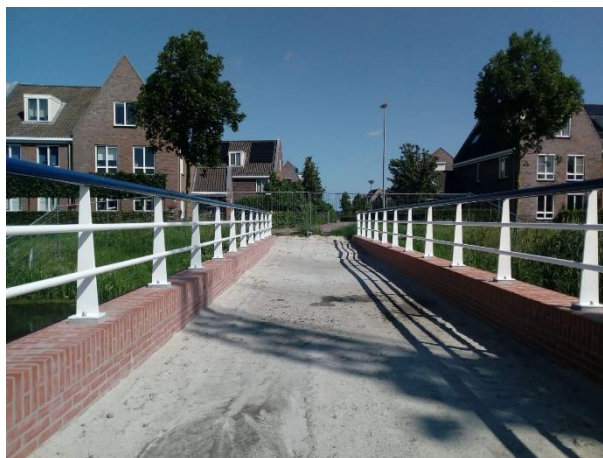
Foto 2 Brug vanaf Reitdiep naar Kleiwerd

Oorspronkelijk was het de bedoeling de brug pas later te bestraten en open te stellen. Dit heeft te maken met kabels en leidingen die nog door de brug gelegd moeten worden. Voor een veilige fiets- en wandelroute maken wij graag de brug eerder klaar voor de bewoners. Dit doen wij wel met een tijdelijke (wel goede) verharding. Dat betekent dat de definitieve verharding later wordt aangelegd.